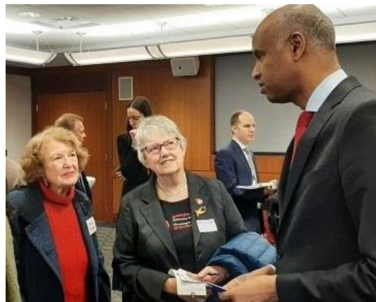
Deux membres de GRAN de la Colombie-Britannique parlent avec le Ministre du Développement international

Nous écrivons à nos députés, nos ministres et le Premier ministre et nous les rencontrons. Nous utilisons les médias sociaux pour rejoindre les décideurs et amplifier les campagnes sur les réseaux sociaux de nos partenaires. Nous signons des pétitions et les faisons circuler. Nous organisons des événements d'éducation populaire. Nous envoyons des lettres et des opinions aux éditeurs de journaux. Nous participons à des manifestations pacifiques. Enfin, nous organisons des événements d'apprentissage, des webinaires et des conférences et nous y assistons.