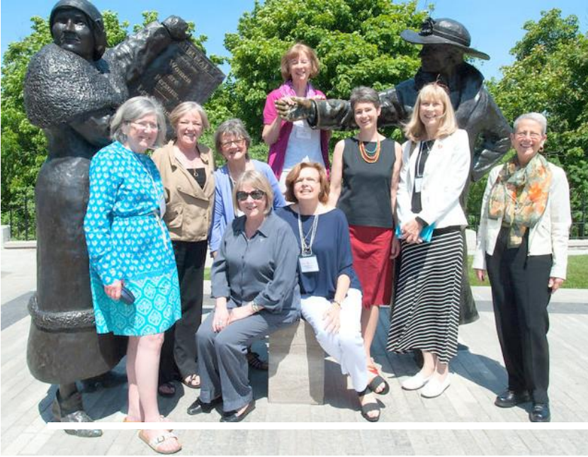
Équipe de Direction – Bonjour Amies

La troisième rencontre de Gran a eu lieu à Ottawa avec la participation de soixante-dix personnes en provenance de tous les coins du pays. Nous avons passé trois jours de réseautage à apprendre de l'une et l'autre, de nos partenaires, et d'orateurs invités exceptionnels. Le thème pour 2015 était ``Renforcer nos liens, grandir notre mouvement``. Nous avons réfléchi sur les leçons apprises, tant individuellement qu'en groupes et avons gagné une plus grande compréhension des questions et initiatives de plaidoyer sous la responsabilité de nos trois Groupes de travail. Tous nos remerciements à l'Équipe national de planification et à la superbe organisation de l'équipe d'Ottawa!